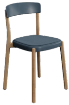
4L WOOD SIN BRAZOS